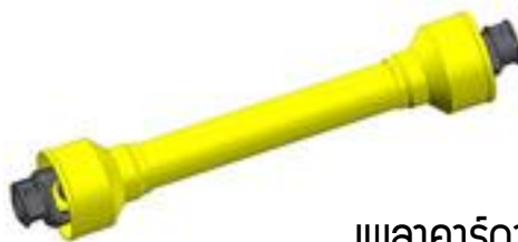
เพลาคาร์ดาน hp 20x700mm (Cardan Shaft hp 20x700mm)