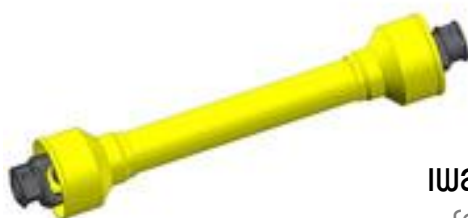
เพลคาร์แดน hp 20x700mm (Cardan Shaft hp 20x700mm)