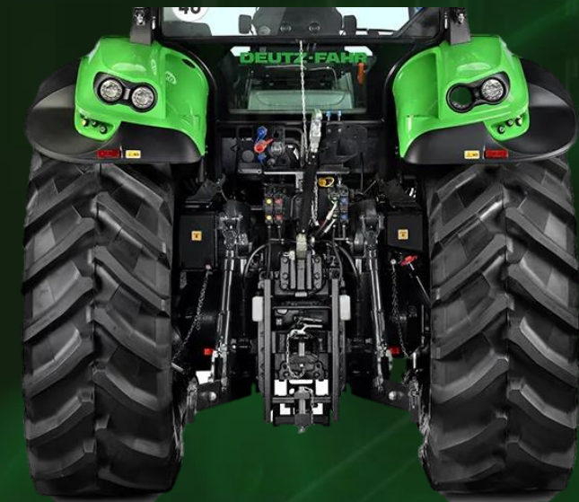
กำลังยกลิฟท์ท้าย 10,500 กิโลกรัม

ระบบ Power-Beyond ช่วยให้อุปกรณ์ที่มีมอเตอร์ไฮดรอลิกสามารถเชื่อมต่อได้ โดยการเชื่อมต่อ "โดยตรง" กับปั๊มของรถแทรกเตอร์ ติดตั้งตัวยกด้านหลังแบบอิเล็กทรอนิกส์อันทรพลัฟ ฟังก์ชันหลักทั้งหมดของลิฟต์สามารถตั้งค่าได้อย่างง่ายดายบนแผงควบคุม