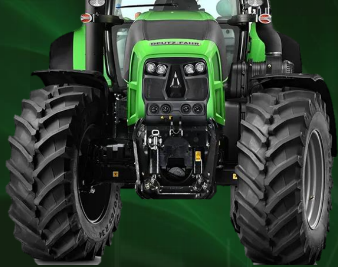
กำลังยกลิฟท์หน้า 5,100 กิโลกรัม