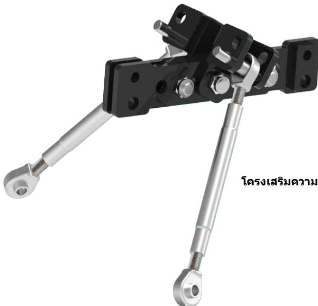
โครงสร้างเสริมความแข็งแรง