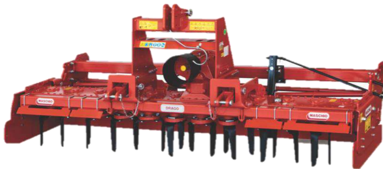
รุ่น DRAGO DC