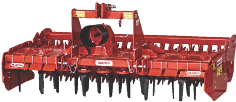
รุ่น DELFINO SUPER