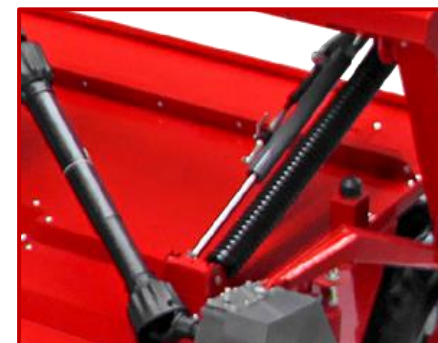
ปรับระดับตัวเครื่องได้ตามพื้นที่ดินที่ขรุขระ ADJUSTABLE TABLE ON ROUGH TERRAIN