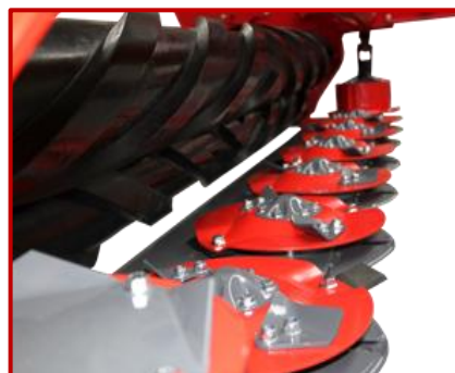
บาร์ตัดที่มีความแข็งแรงสูง STRONG MOWING UNIT