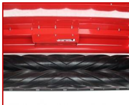
ลูกกลิ้งผลิตจากโพลียูรีเทนทั้งชิ้น ONE PIECE POLYURETHANE ROLLER