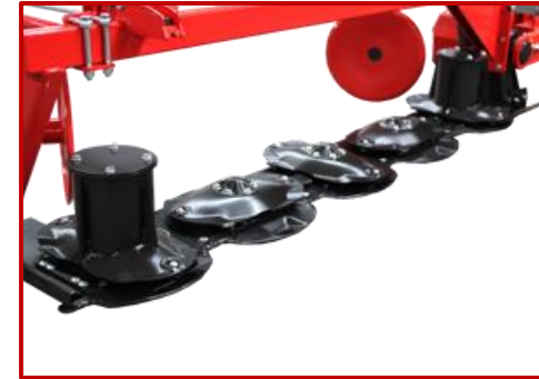
เครื่องตัดหญ้า HARMAK รุ่น STRONG HARMAK STRONG MOWING UNIT