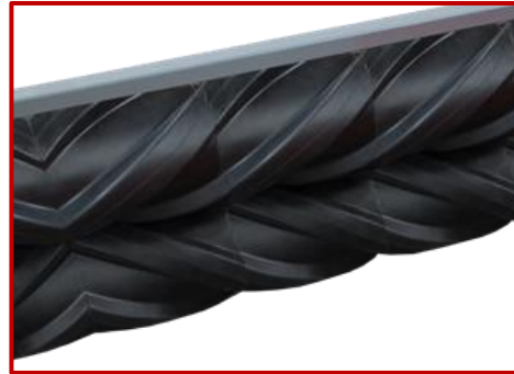
ลูกกลิ้งยาง RUBBER ROLLER