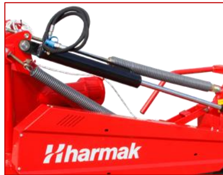
ระบบลูกสูบและสปริงความแข็งแรงสูง STRONG PISTON AND SPRING SYSTEM