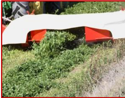
ปรับความกว้างของช่องปล่อยหญ้าได้ ADJUSTABLE BARREL WIDTH