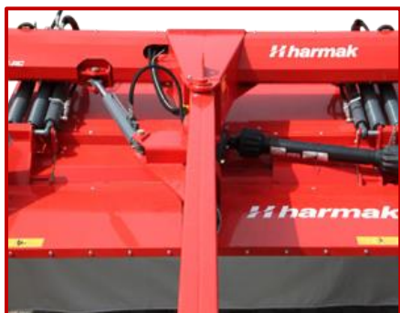
ระบบโซ้คแบบเทเลสโคปิค TELESCOPIC SYSTEM