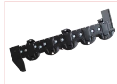
โครงกลางเสริมความแข็งแรง REINFORCED MOWING UNIT SLIDE