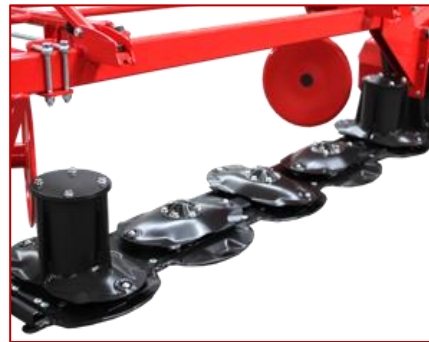
เครื่องตัดหญ้า HARMAK รุ่น STRONG HARMAK STRONG MOWING UNIT