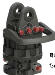
อุปกรณ์เสริม

OMEF-GROUP FORESTRY CLAMP ได้รับการพัฒนาเพื่อให้มีประสิทธิภาพที่ดีที่สุดในการเก็บเกี่ยวและตัดไม้ เพื่อรับประกันความต้านทานต่อโครงสร้างที่มากขึ้นจึงถูกนำมาใช้ของแผ่นเสริมแรงบนพื้นของกรงเล็บ คีมมีให้เลือก 6 ขนาด ทั้งสองรุ่นด้วยทูปแบบเปิดและทูปแบบปิด