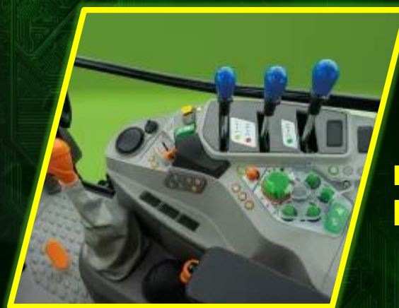
เกียร์อัตโนมัติ POWERSHIFT