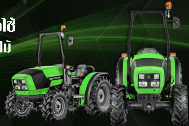
รุ่น AGROPLUS F 65