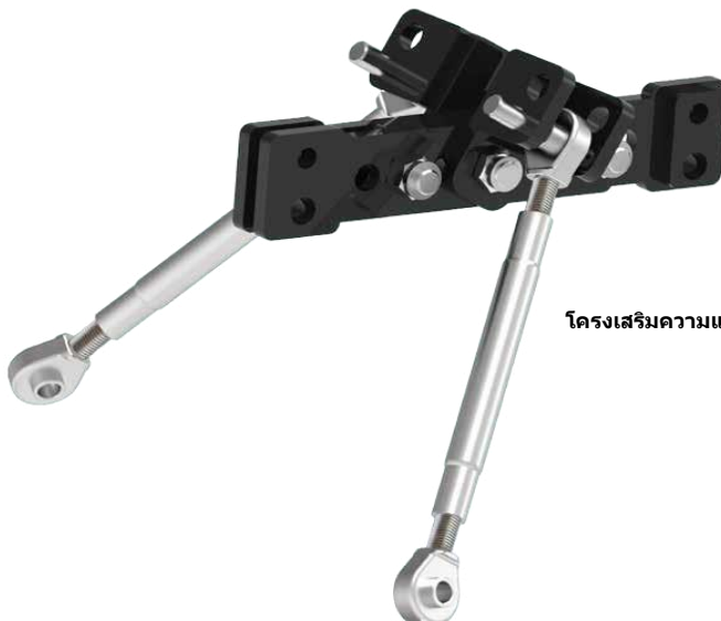
โครงเสริมความแข็ง